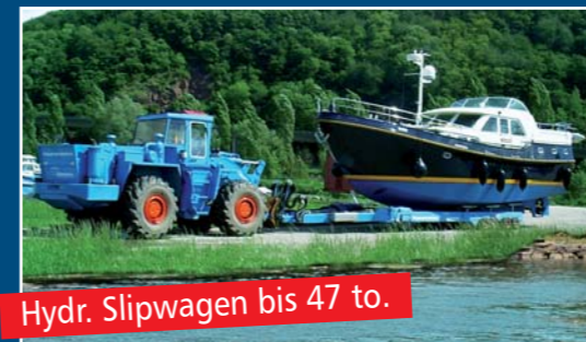
Hydr. Slipwagen bis 47 to.