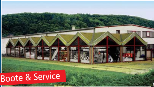
Boote & Service

Ausgezeichnet mit der "Blauen Europa Flagge"