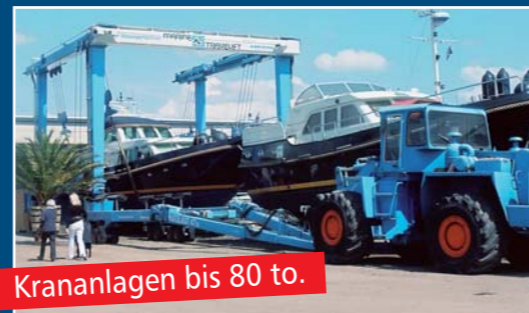
Krananlagen bis 80 to.